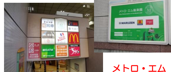
メトロ・エム 後楽園