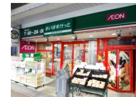
スーパー まいばすけっと