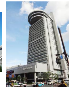
文京シビックセンター