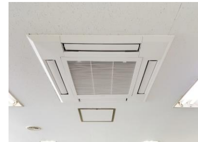
天井埋込型エアコン2台付 2023.5 設置