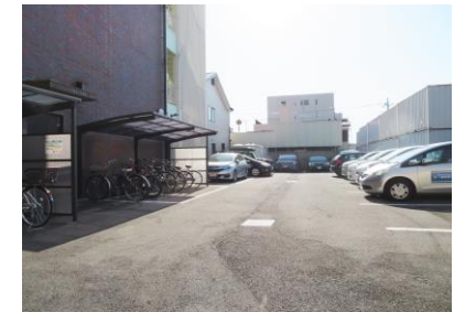
敷地内駐車場 空有