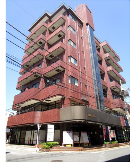
入口自動ドア、間口約11m、前面ガラス張り